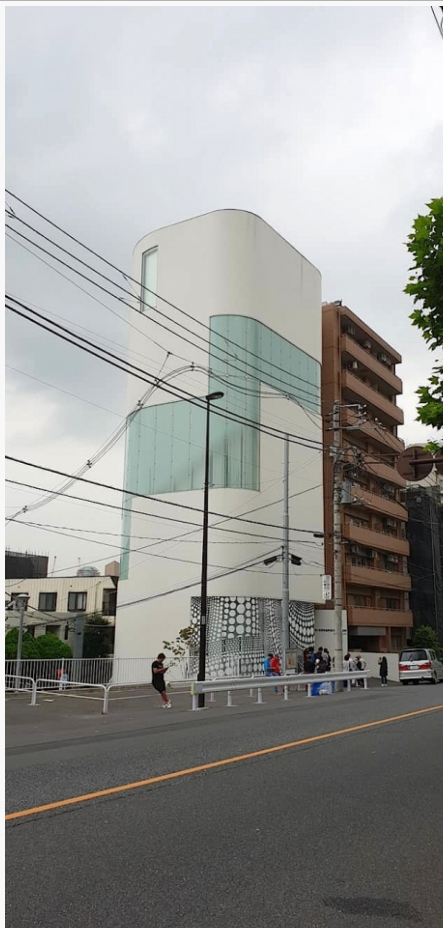
Muzej Jajoi Kusame u Tokiju

Ljubaznošću tokijskog Muzeja Jajoi Kusame, imala sam privilegiju da posetim i najnoviju postavku radova Jajoi Kusame (Yayoi Kusama, 1929) pod nazivom: Ovde, još jedna noć udaljena bilionima svetlosnih godina: večna beskonačnost.