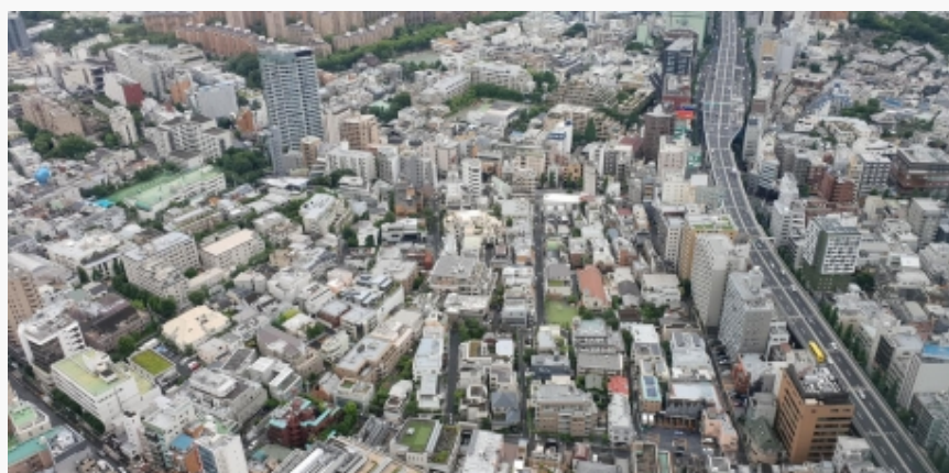
Pogled sa 52. sprata zgrade u kojoj je smešten Mori muzej u Tokiju

kvartu Ropongi, na 52. spratu oblakodera koji je sagradio investitor za nekretnine Minoru Mori, sa kojeg se pruža panoramski pogled na Tokio. Ovaj muzej izlaže etablirane umetnike kao što su Takaši Murakami, Aj Vejvej ili Bil Viola, ali pruža šansu i stvaraocima mlađe generacije.