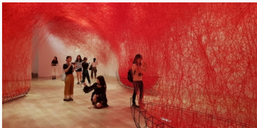
Posetioci oduševljeni delom Čiharu Šiote

Izložba Čiharu Šiote u Mori umetničkom muzeju u Tokiju pod nazivom Drhtaji duše (The Soul Trembles) predstavlja do sada najsveobuhvatniju prezentaciju njenog rada koji tematizuje motive prisustva i odsustva, individualne i kolektivne memorije, snove, anksioznost i granice. Čine je njeni raniji radovi iz 90-tih godina prošlog veka, skulpture, video-radovi, crteži, dokumentacije performansa, kao i najnovijija dela. No, najveću pažnju privlače instalacije sačinjene od crnog ili crvenog "pletiva" koje premrežavaju izložbene sale stvarajući "neograničene prostore koji se postepeno šire u svemir".