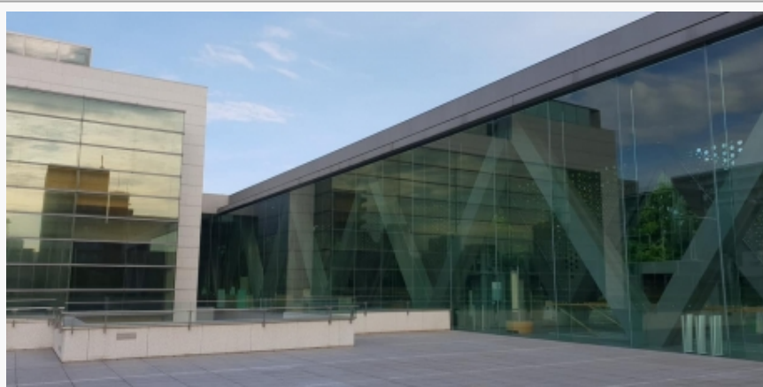
Zgrada Muzeja MOT u Tokiju

Upravo se ovi motivi iščitavaju u podtekstu najnovije izložbe Muzeja savremene umetnosti Tokija (MOT) A sada je vreme za igru (Now, it's time to play) koja se može pogledati do 20. oktobra 2019. godine.