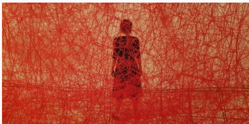
Rad Čiharu Šiote u Mori umetničkom muzeju u Tokiju

Do 27. oktobra 2019. godine, u Mori muzeju se može pogledati retrospektiva 25-godišnjeg rada Čiharu Šiote (Chiharu Shiota, 1972), predstavnice Japana na Bijenalu u Veneciji 2015, poznate po performansima i instalacijama sa motivima paučinastih niti.