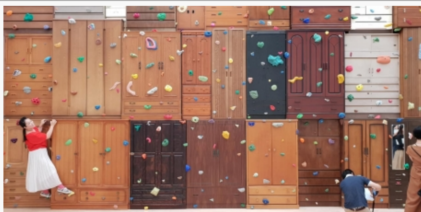
Interakcija dela i publike u Muzeju MOT

Na izložbi, koja je privlačna i odraslima i deci, šestoro japanskih umetnika/ umetničkih grupa (Yoshiaki Kaihatsu, Kazuhiro Nomura, team Hamburg, Tanotaiga, TOLTA, Usio) propituje socijalne kodove, društvene vrednosti, bavi se odnosom individualnosti i konformizma, poigrava se smislom i kroz društvene igre, reči, slike i narative posetioce uvodi u neočekivana iskustva. Njihovi radovi se smeju dodirivati, fotografisati, premeštati, doctavati, oni su stimulatívni, podstiču kreativnu energiju i maštu. Posetioci se pozivaju da se, po principu veštačke stene, popnu na umetnički rad-instalaciju, da vlastitom snalažljivošću izađu iz lavirinta, intervenišu u prostoru, crtaju, da se poigraju i odupru ultimatumu kolektiva koji glasi:”Sledi siguran put. Ne izdvajaj se od okoline. Nemaš pravo na grešku.”