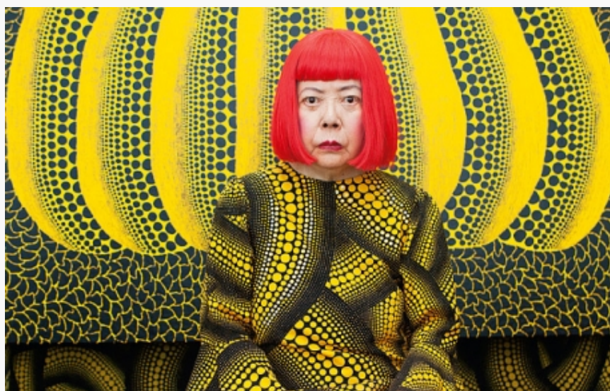
Jajoi Kusama

Brojni hešttagovi sa njenim imenom upućuju na umetnicu sa ekstravagantnim perikama, u odeći sa motivima sopstvenih dela – omiljeni dekor za selfi instagram generacije, ali ko je zapravo Jajoi Kusama, široj javnosti najpoznatija po tačkicama, beskrajoj sobi sa ogledalima i instalaciji žute bundeve sa crnim tufnama? Umetnica koja sopstvene psihičke probleme transponuje u skulpture, instalacije, slike, performanse, film, modu, literaturu i fotografiju zasnovane na konceptualnoj umetničkoj praksi, feminističkom, minimalističkom konceptu i umetnosti apstraktnog ekspresionizma.