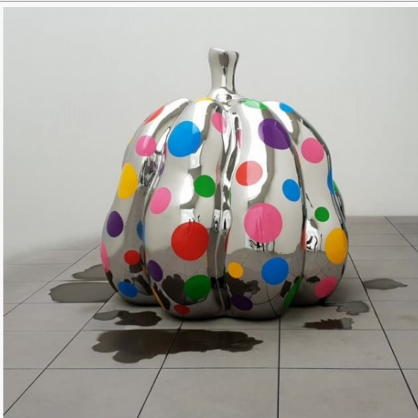
Instalacija po imenu Bundeve Jajoi Kusame u njenom muzeju u Tokiju