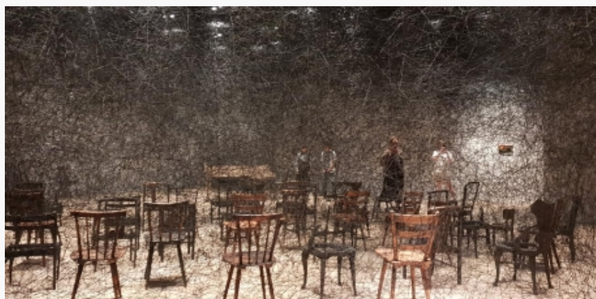
Instalacija Čiharu Šiote u muzeju MORI

zašto njene instalacije inspirišu posetioce na interakciju, fotografisanje, selfi, ali i suočavanje sa sopsvenom duhovnom biografijom. Inače, mreže po kojima će postati poznata, Šiota počinje da plete u sopstvenoj sobi, nakon što se nastani u Nemačkoj, seleći se iz jednog stana u drugi, žudeći za prostorom koji će joj pružiti iluziju sigurnosti i doma.