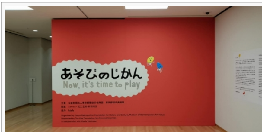
”A sada je vreme za igru”, MOT, Tokio

realni, praktični život”. Iako su naizgled kreirani za zabavu, u podtekstu ovih radova nalaze se teme kao što su: pritisak kolektiva, kompeticija, psihologija stoičkog trpljenja i sl. Ali, sem što metaforičke konotacije radova skreću pažnju na akutne sociološke probleme, ova u osnovi interaktivna izložba podstiče posetioca da se opusti, da kroz igru pobegne od rutine i svakodnevice, razvije drugačiji način percepcije i pristupa problemu.