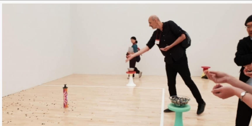
Interaktivni radovi u MOT-u u Tokiju

Muzej savremene umetnosti Tokija (MOT), čije su najnovije akvizicije, takođe dostupne javnosti, otvoren je 1995. godine, u Kiba parku, istočno od reke Sumida sa ciljem da se sistematizuje, sačuva i izloži kolekcija savremene vizuelne umetnosti orjentisana ka posleratnoj japanskoj umetnosti, mada uključuje i inostrane autore. Nakon trogodišnje obnove, MOT je ponovo otvoren za javnost proleća 2019. Stalna kolekcija ima 5,400 radova, među kojima su i dela Endija Vorhola, Roja Liktenstajna, Dejvida Hoknija, Jajoi Kusame, Frenka Stele, Jiro Jošihare i dr.