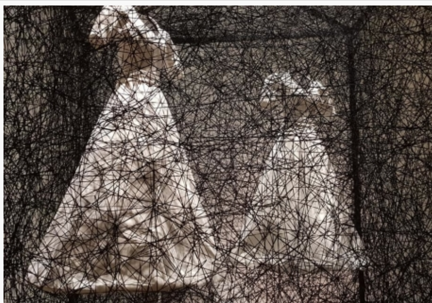
Instalacije Čiharu Šiote u Mori umetničkom muzeju

“Kada postane nemoguće okom pratiti nit ili umetnički rad, počinjem da osećam da je završen”, ističe Šiota. “Verujem da se u radu istina pojavljuje u trenutku kada ga više ne možete videti golim okom.”