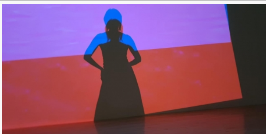
Sa postavke u MOT-u

Iako primarna asocijacija na Tokio nije savremena umetnost, još jedan muzej savremene umetnosti, Mori umetnički muzej, privlači značajan broj turista budući da je smešten u poznatom tokijskom