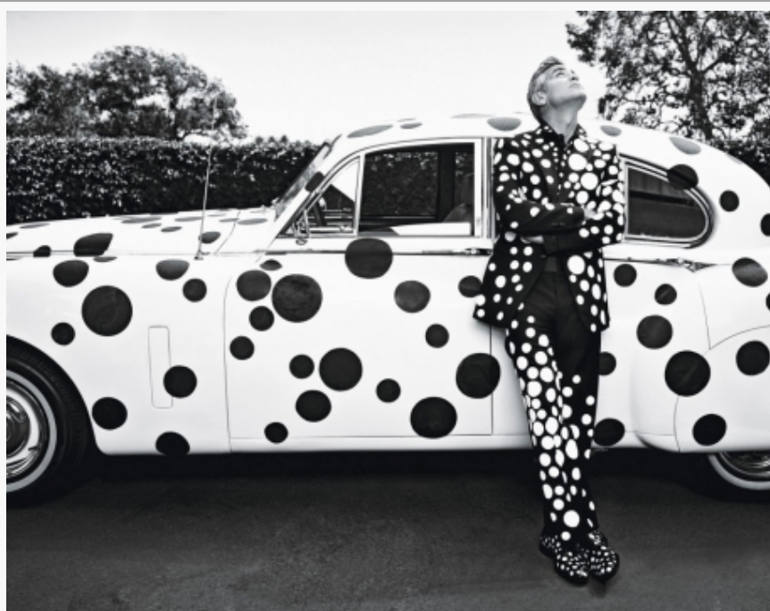
Džordž Kluni, dizajn Jajoi Kusame za W magazin.

No, iako sam dosta toga pročitala o Kusami, prvi put sam jedan njen rad videla tek prošle godine, tokom umetničke rezidencije u Kvartu muzeja u Beču – Srebrnu haljinu izloženu u MUMOK-u. Upravo je to delo, kao i moje propitivanje Ženskog diskursa u umetnosti , bio razlog zašto sam poželela da posetim Muzej Jajoi Kusame, kojim rukovodi Fondacija koja u nazivu nosi njeno ime. Muzej specifične minimalističke arhitekture, idejno rešenje studija Kume Sekei, otvoren je prvog oktobra, 2017, u tokijskoj četvrti Šinđuku. Aktuelna postavka sadrži dela u kojima se očitava autorkina fascinacija beskonačnošću, korišćenje ogledala, svetlosnih efekata. Na izložbi se nalaze njeni rani, njujorški radovi iz serije Beskonačne mreže , ali i noviji kao što je svetlosna instalacija Stepenice za nebo (2019) ili slike Obožavanje beskrajnog prostora i Zaustavimo rat nastale tokom poslednjih godina, kao i Bundeva (2015) od nerđajućeg čelika s bojama koje aludiraju na svemir.