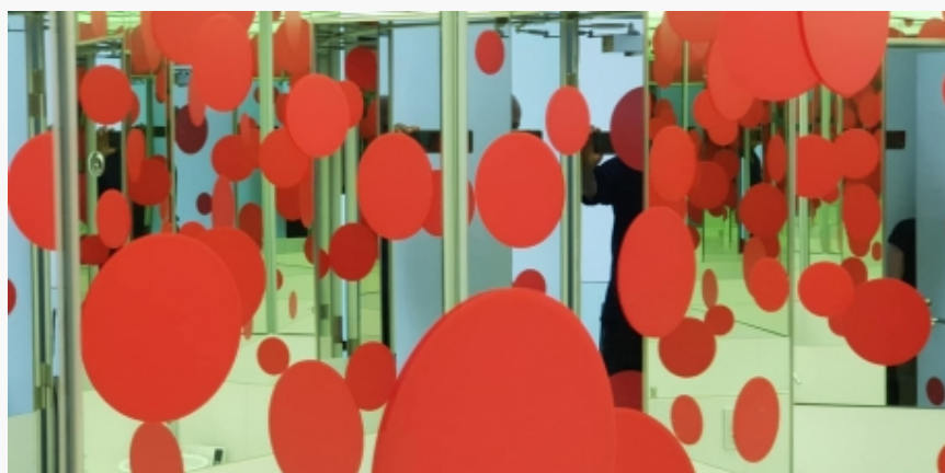
Lift u muzeju Jajoi Kusame