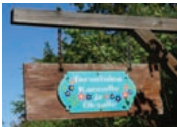
Dobrodošlica na finski način

ljubavi, samosažaljenju, čežnji, ljubavnoj tuzi i bolu stvarajući neistinitu sliku o jednoj luckastoj naciji koja pleše po putevima i šumama.